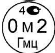
Рисунок 4.2. Знак поверки государственного научного метрологического института