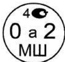
Рисунок 4.1. Знак поверки государственного регионального центра метрологии